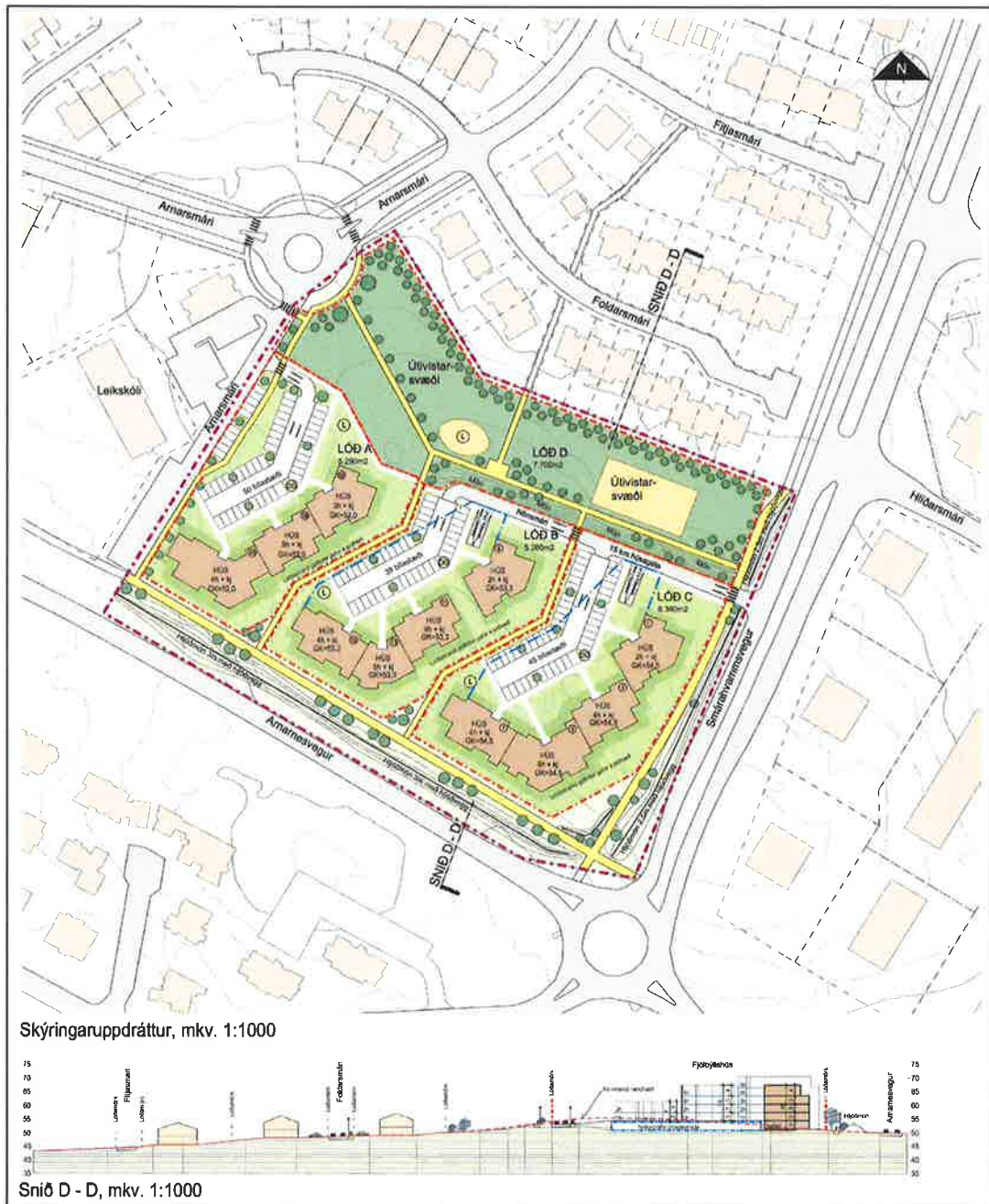
Mynd 1. Skipulagssvæði Nónhæðar. (Teikn. Arkís arkitektar).